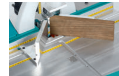
Innenanschlag mit Erhöhung