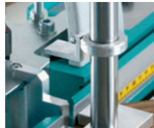
Frähhöhen- und Hebelwegbegrenzer