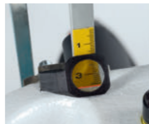
Skala mit Vergrößerungslupe