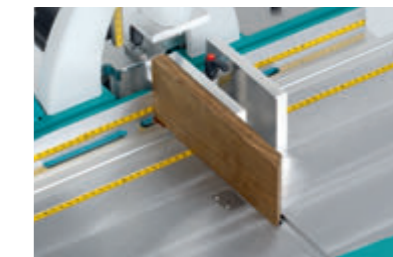
Stumpfanschlag mit Erhöhung