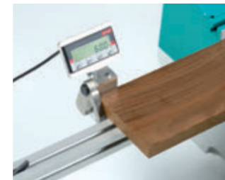
Digitalanzeige für Klappanschläge