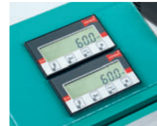
Digitalanzeige Fräsposition Digitalanzeige Frästiefe