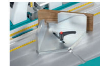
Anschlagplatte mit Erhöhung