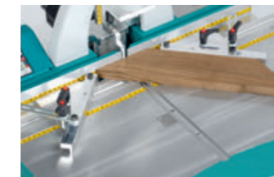
Innenanschlag mit Winkelverstellung