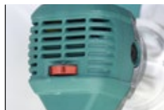
Velocidad del motor de fresado