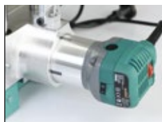
Motor de fresado