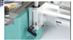
Ajuste de altura de fresado