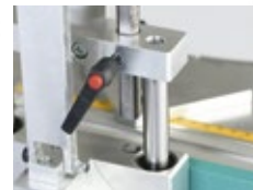
Profundidad de fresado