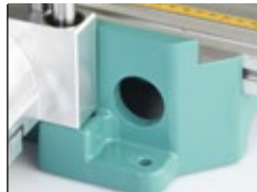
Conexión de aspiración