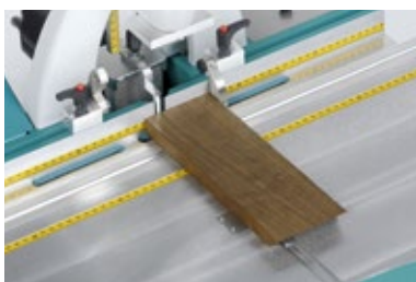
Klappanschlag für hintere Anschlagskante (W3023000)