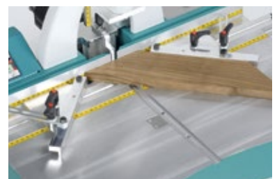
Innenanschlag mit Winkelverstellung, Set (W3012000)