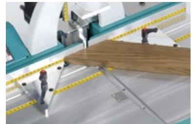
Innenanschlag, Set (W3010000)