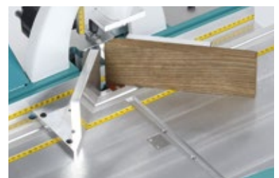
Innenanschlag-Erhöhung, Set (W3019000)