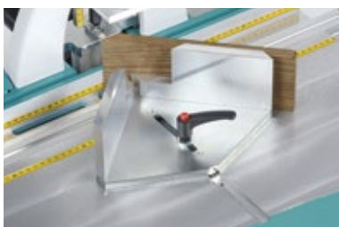
Anschlagplatte-/Rechteckanschlag 45°-Erhöhung (W3017000)