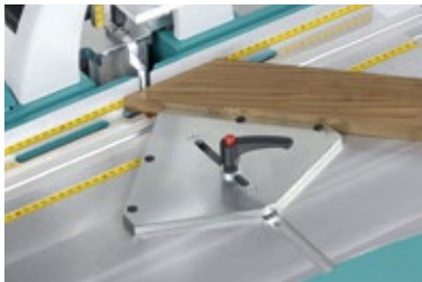
Anschlagplatte/ Rechteckanschlag 45° (W3060000)